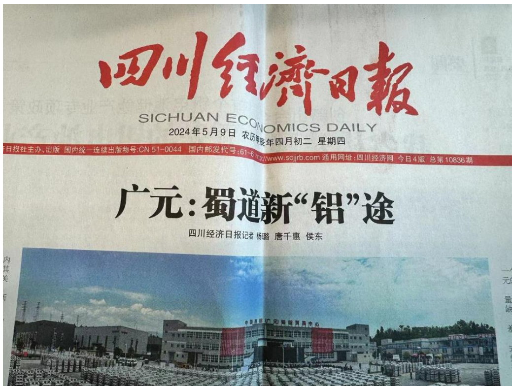
图 3 项目征求意见稿第一次登报公示截图