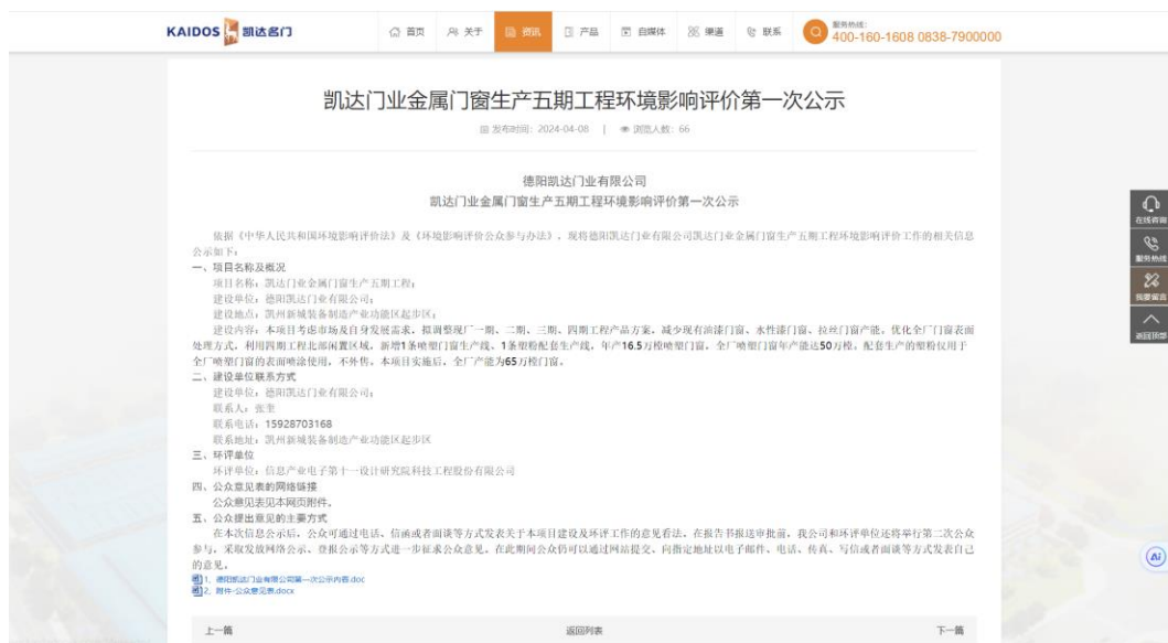
图1 项目首次网络公示截图

首次公开网站为德阳凯达门业有限公司官网，公开时间为2024年4月8日-4月19日10个工作日。