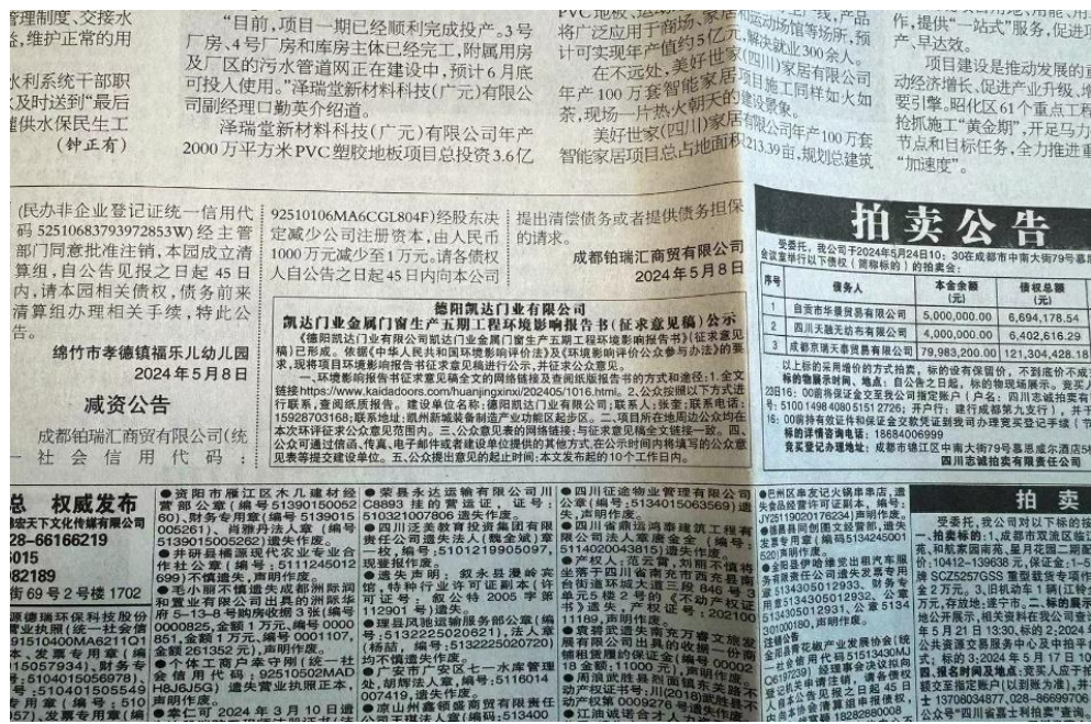
图 4 项目征求意见稿第二次登报公示截图

《四川科技报》和《四川经济日报》为我市境内易于接触的报纸，因此。项目征求意见稿登报公示载体选取满足《环境影响评价公众参与办法》要求。